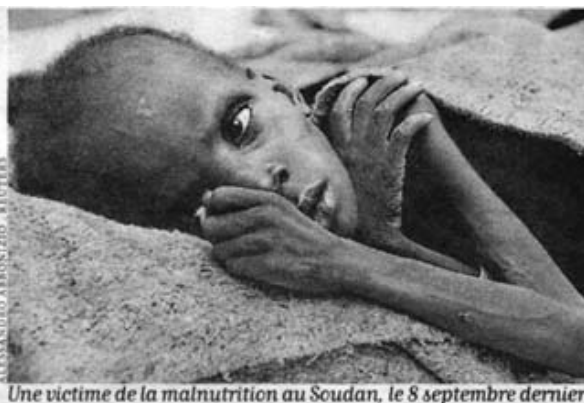
Une victime de la malnutrition au Soudan, le 8 septembre dernier.

1 Il y a près d'un demi-siècle, un médecin, Josué de Castro, dénonçait la famine organisée de certaines populations brésiliennes dans un livre au titre saisissant, Géopolitique de la faim . Son analyse reste d'une brûlante actualité, dit Sylvie Brunel, qui coordonne un ouvrage qui porte le même titre, fruit du travail collectif d'hommes