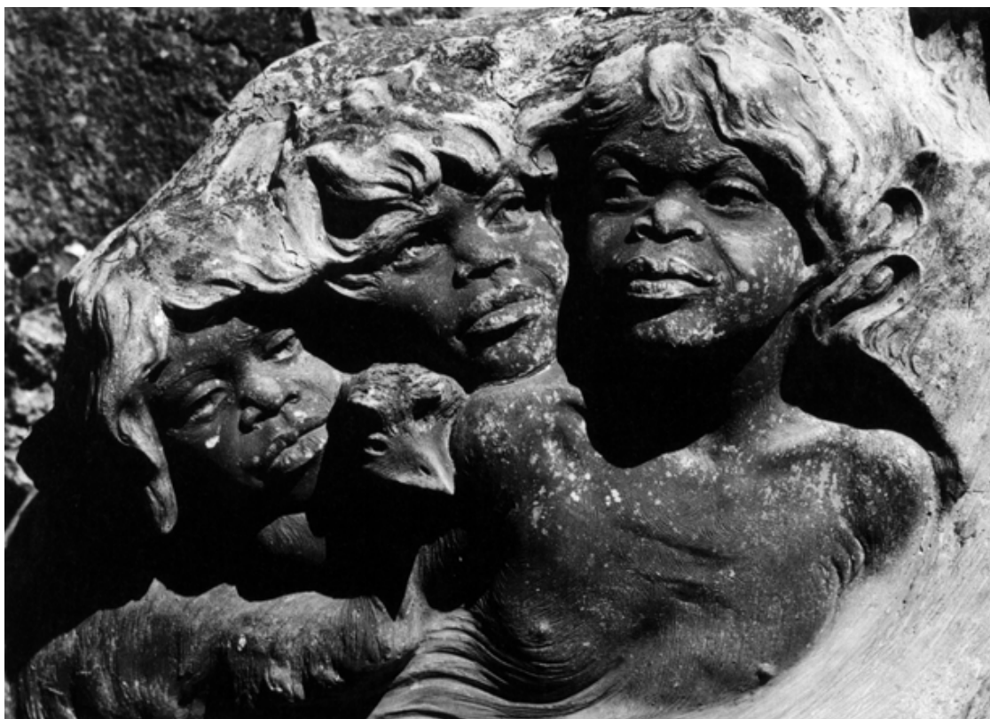
Un hommage du sculpteur Ricketts, adepte de la philosophie aborigène et fondateur du sanctuaire New world.